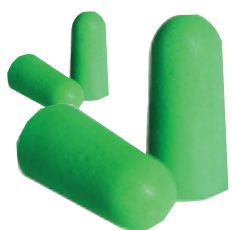
Quantum Foam s/cordel

Colocación y ajuste de Protectores Auditivos endoaurales auto-expansibles, desechables