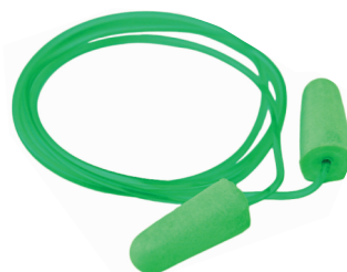
Quantum Foam c/cordel