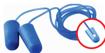
Quantum Foam c/cordel Detectable